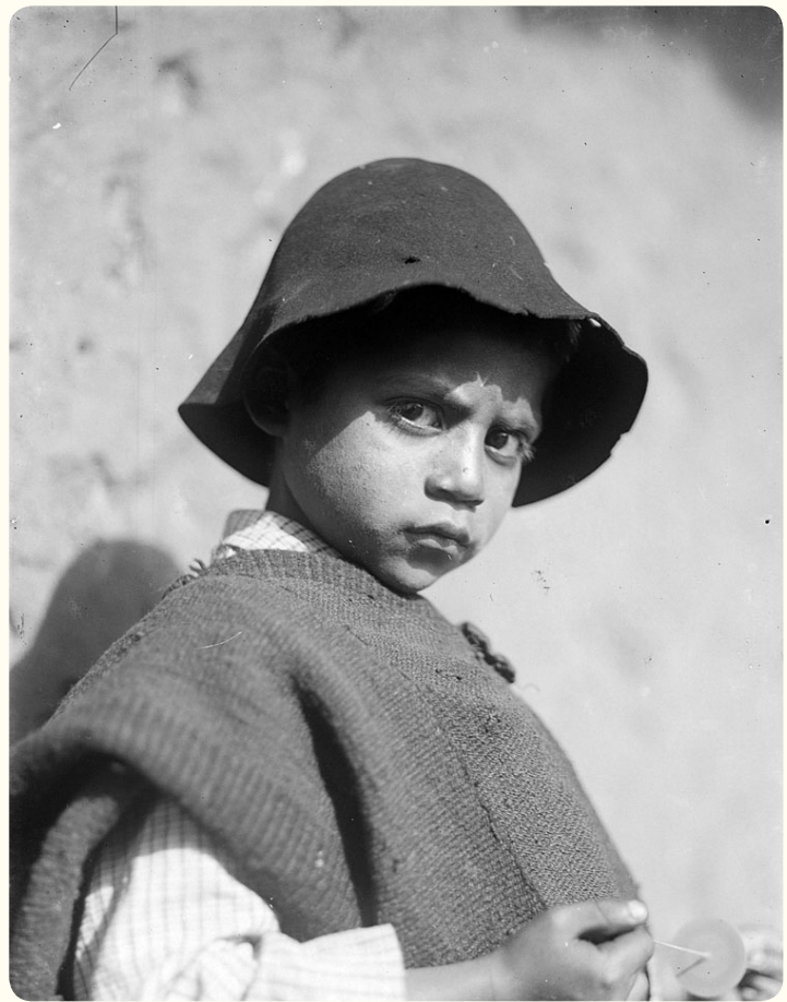
Niño jugando con un Run Run. Chillán, principios del siglo XX.