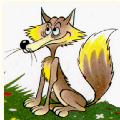
Chacal (color verde)