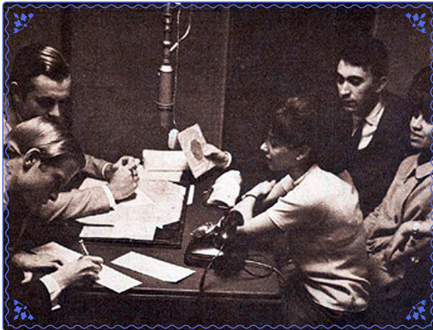
Programa "Fogatas" en Radio Santiago, 1965.