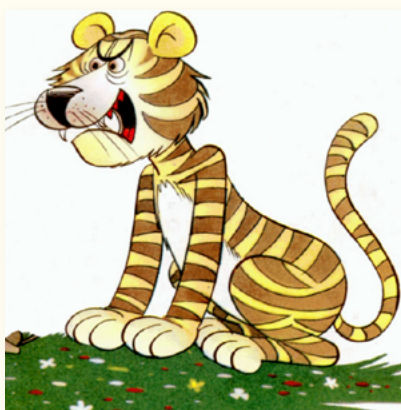
Tigre (color rojo)

No olvides poner un nombre a tu programa de radioteatro. Debes comenzar presentando el programa, a las personas que participan y luego informar el nombre del cuento y su autor.