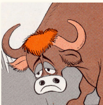
Búfalo (color café)