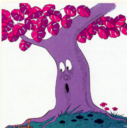
Higuera (color morado)