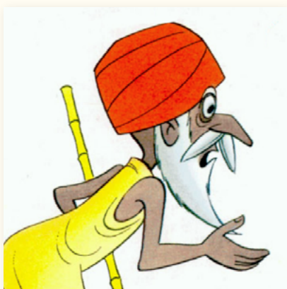
Brahman: hombre religioso de la india (color azul)