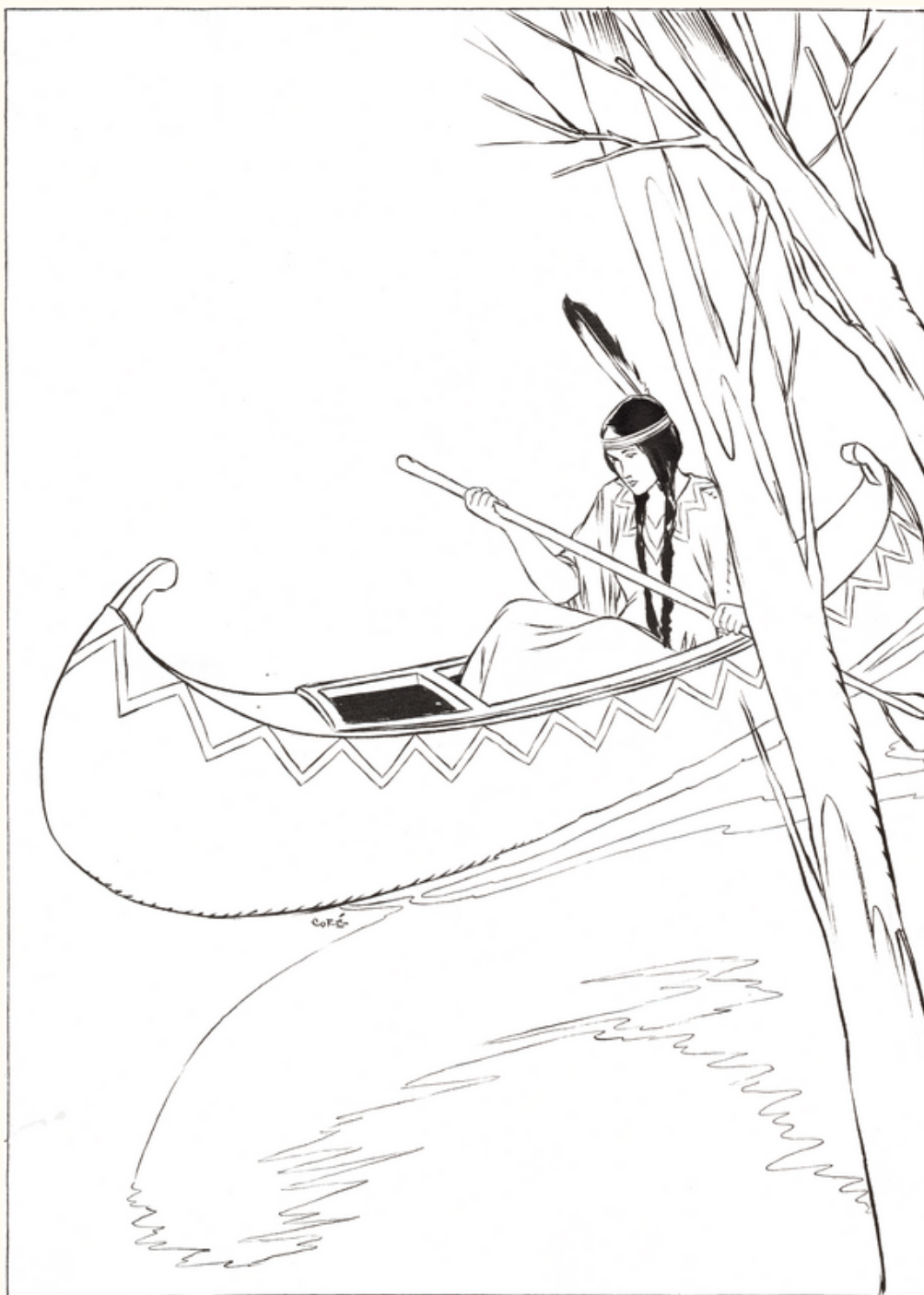
El hijo del gran espíritu