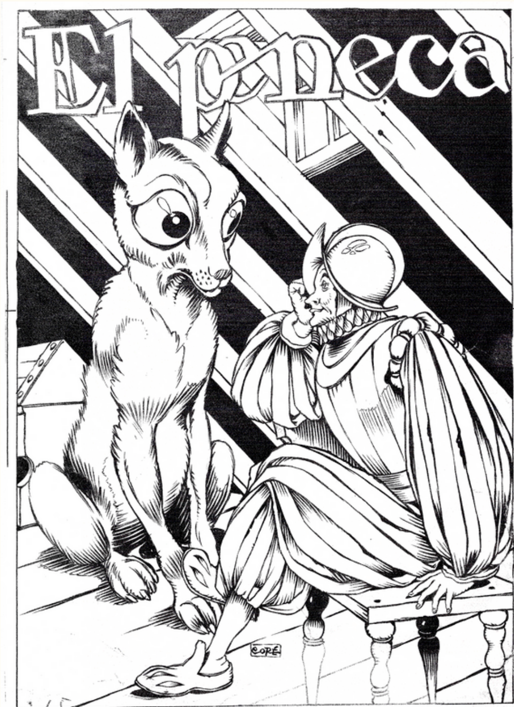
La caja de yesca